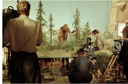
Technika děleného obrazu