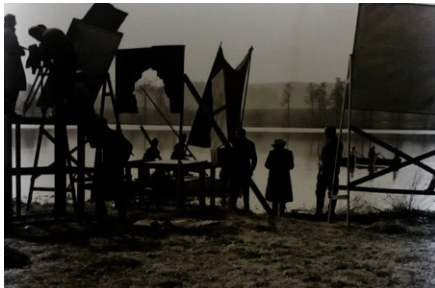
Trikové scény s dokreslovačkou