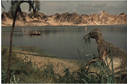
Triková scéna s představeným modelem